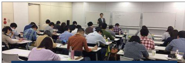
横浜開催の様子 (2017 年 3 月 18 日～19 日)