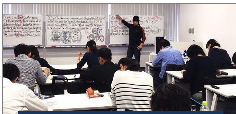
福岡開催の様子(2017年4月15日～16日)